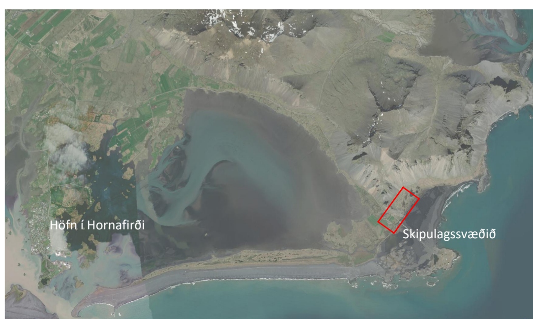
SKÝRINGARMYND EKKI Í KVARÐA

Auglýsing um gildistöku skipulagsins _____ var birt í B-deild Stjórnartíðinda þann _____