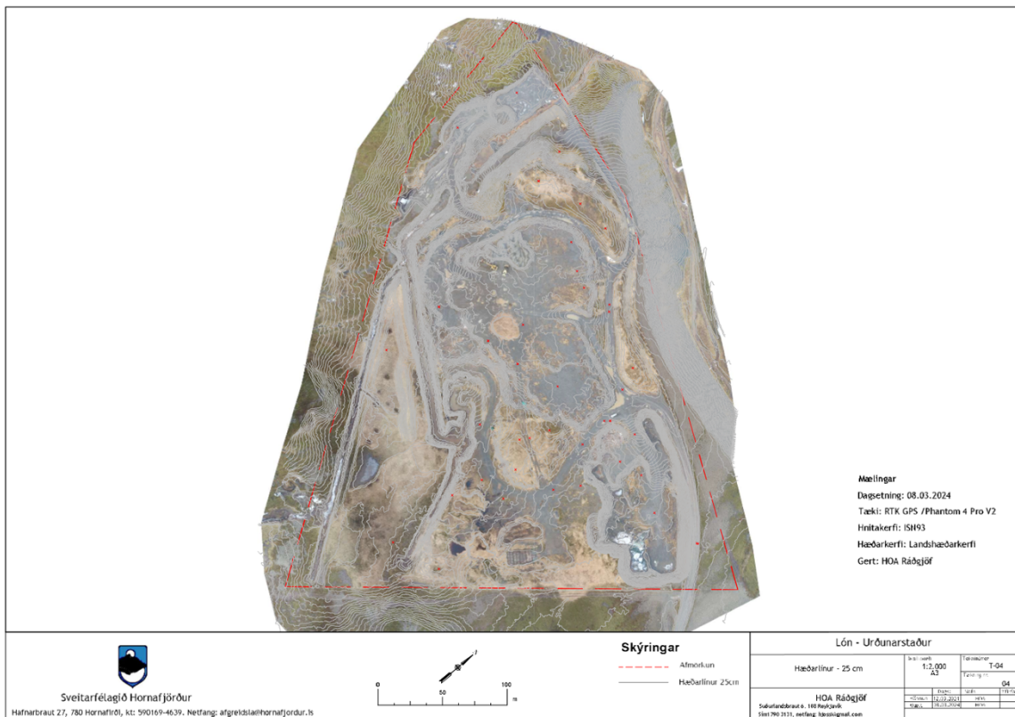
Mynd 2: Loftmyndir frá Sigmælingar 2024