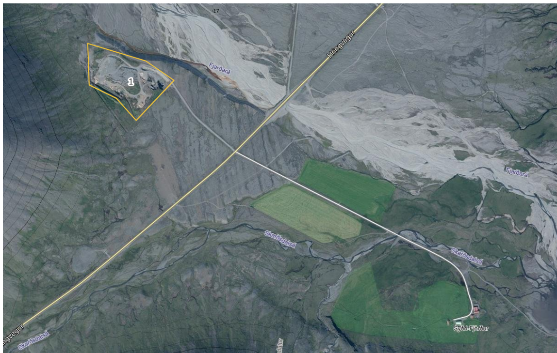
Mynd 1: Urðunarstaðurinn er í landi Syðri-Fjarðar í Lóni og liggur á bökkum Fjarðarár. Hann er merktur með gulum línu.

Starfsemin flokkast sem úrgangstarfsemi nr. 5.4. skv. fylgiskjali með reglugerð um grænt bókhald nr. 851/2002. Allur úrgangur sem fluttur er til urðunar á svæðinu fellur til innan Sveitarfélagsins Hornafjarðar.