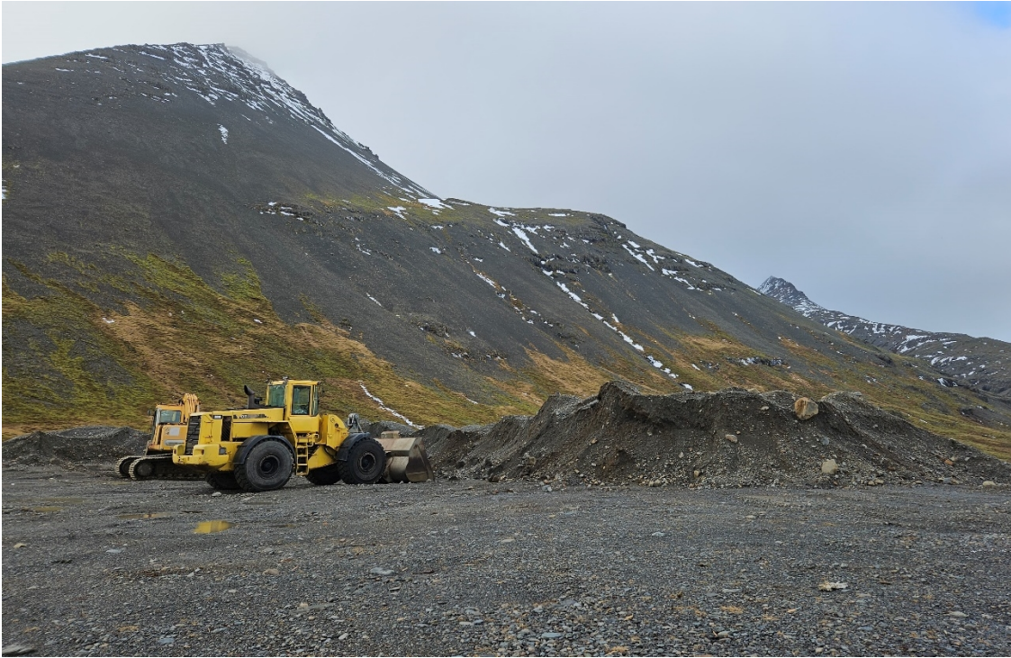
Mynd 4: Mól notuð til að þekja