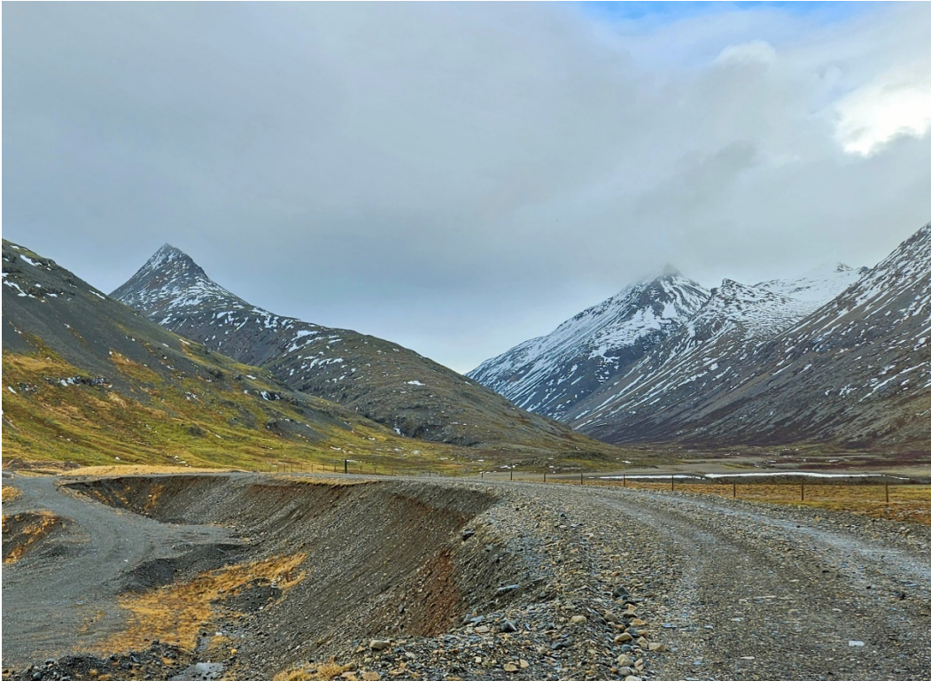
Mynd 3: Horft að urðunarreinunum.