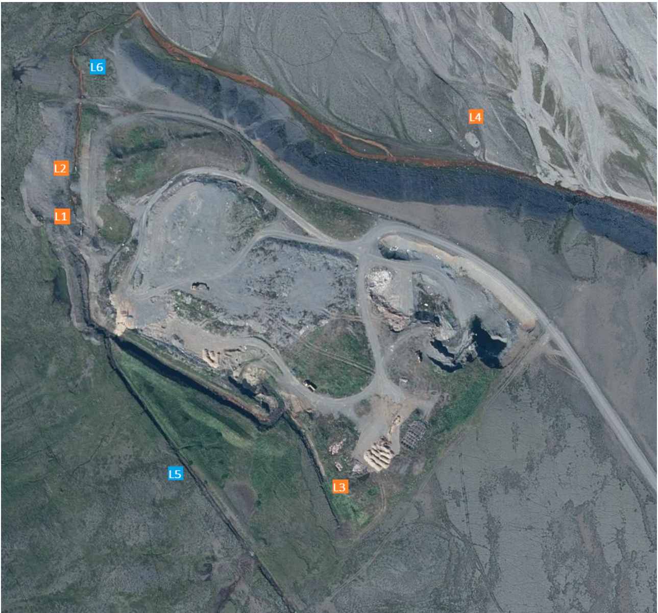
Mynd 5: Sýnatökustaðir á urðunarstað.