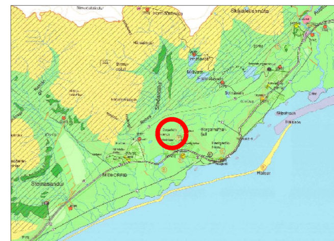
Hluti af sveitarfélagsupprætti Aðalskipulags Hornafjarðar 2012-2030