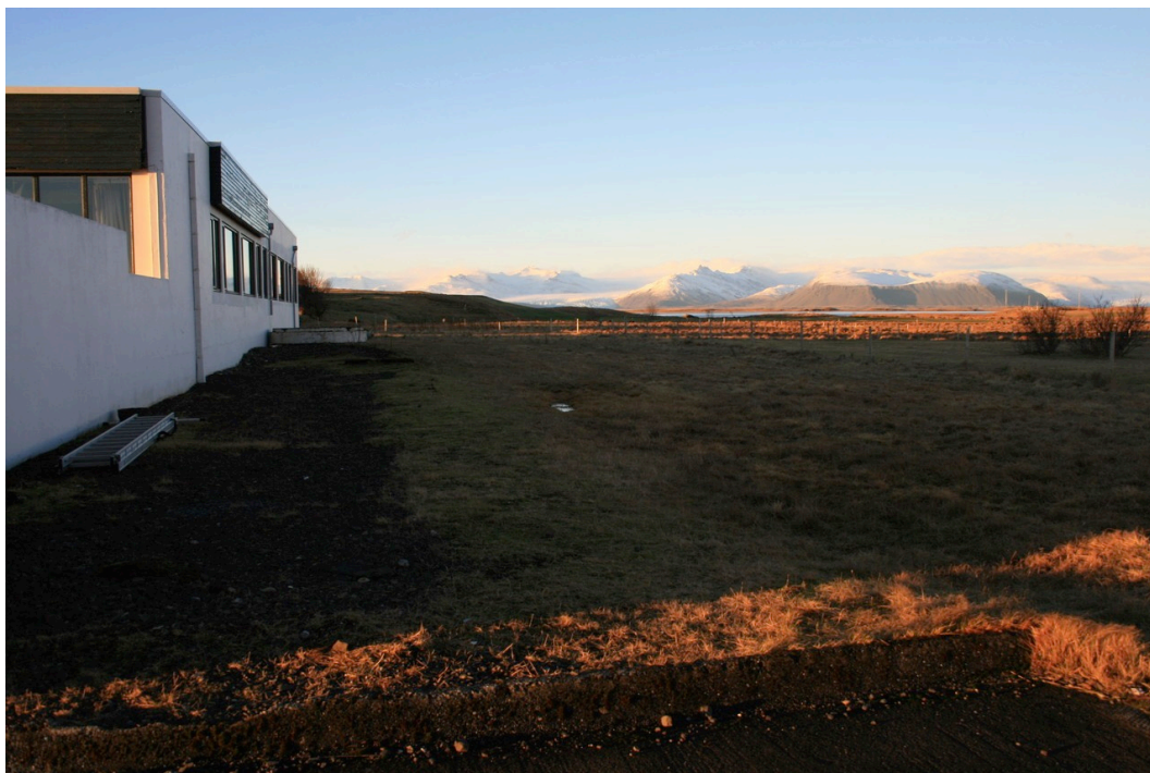
Mynd 5. Dalbraut 2, horft til norðvesturs norðan megin við byggingu. Ljós. SGB, jan. 2019.