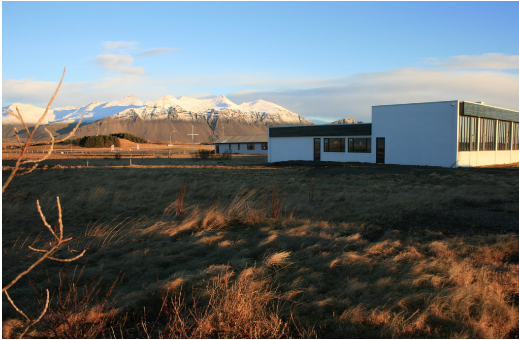
Mynd 2. Lóðin Dalbraut 2, hér horft til austurs. Á lóðinni stendur bygging sem reist var á árunum 1971 – 1973, Mjólkurstöðin. Í dag hýsir hún gistiheimili. Ljós. SGB, jan. 2019.