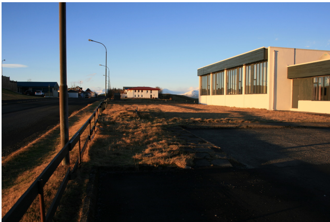
Mynd 4. Dalbraut 2, horft til norðvesturs meðfram suðurhlíð Mjólkurstöðvarinnar. Ljós. SGB, jan. 2019.