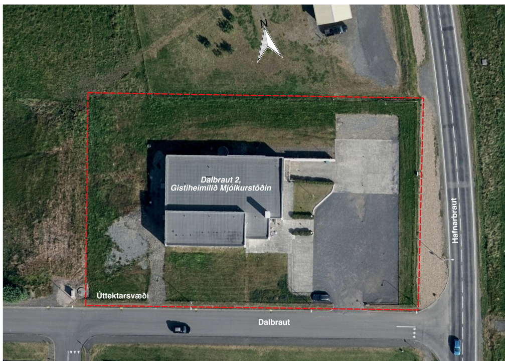
Mynd 3. Myndkort er sýnir úttektarsvæðið varpað á loftmynd Loftmynda ehf. Kortagerð SGB, jan. 2019.