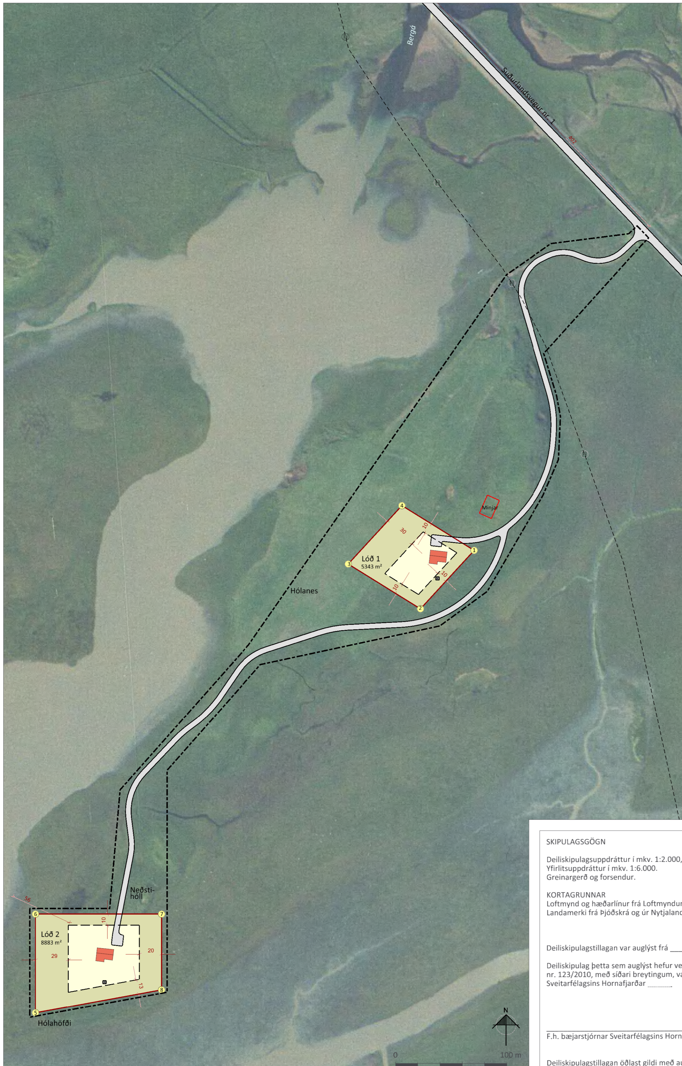
Deiliskipulagsuppráttur í mkv. 1:2.000.