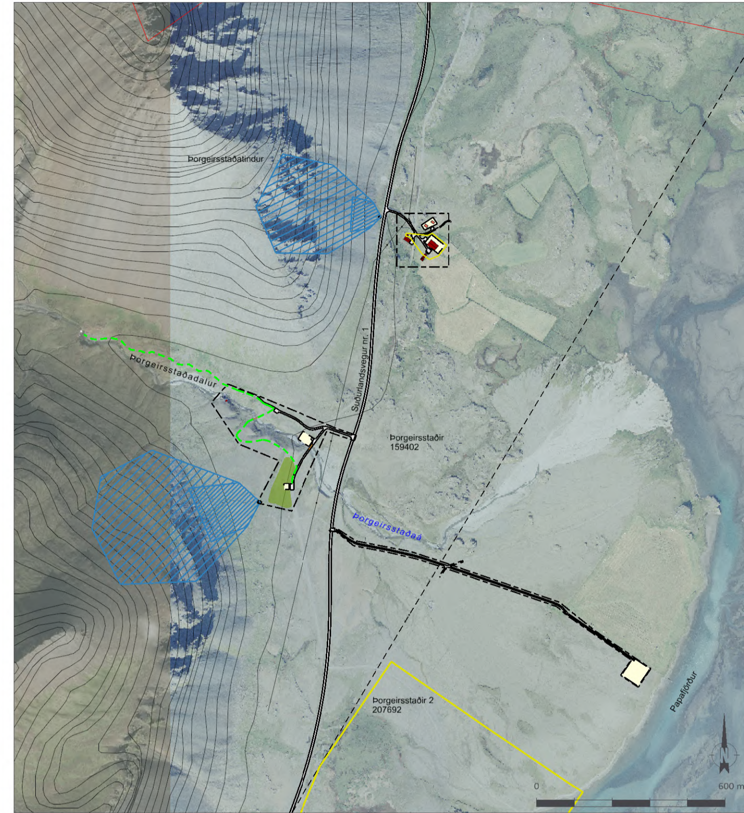
Yfirlitsuppráttur í mkv. 1:12.000.