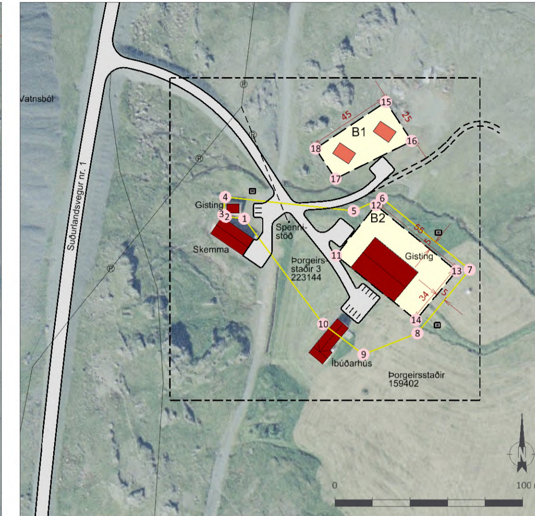
Deiliskipulag fyrir bæjarhlaðið í mkv. 1:2.000.