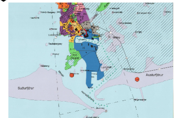
AÐALSKIPULAG Sveitarfélagsins Hornafjarðar 2012-2030